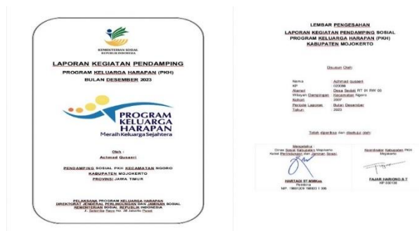
Gambar 3. Laporan Bulanan Koordinator PKH Kecamatan